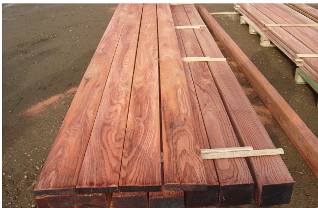
Qualité et précision de coupe au millimètre