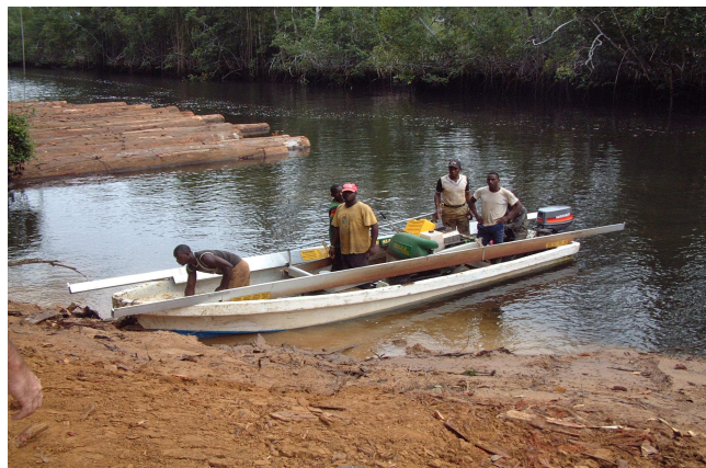
Transportable sur une pirogue