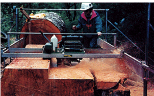
Permet de scier les plus gros bois