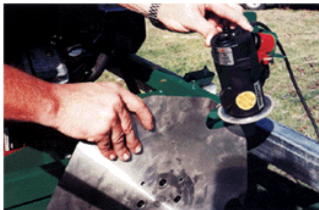
Lame au carbure et affûteuse au diamant