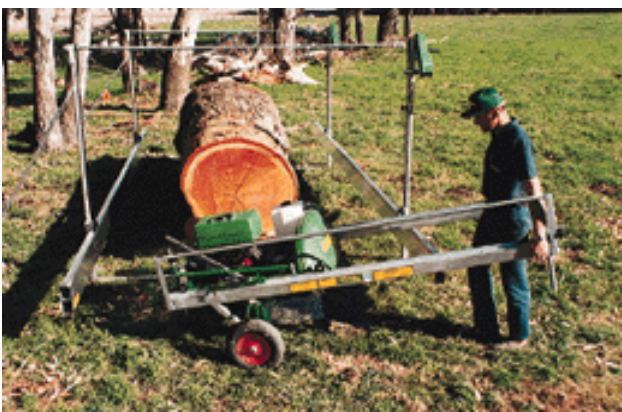
Facile à déplacer et à installer en forêt