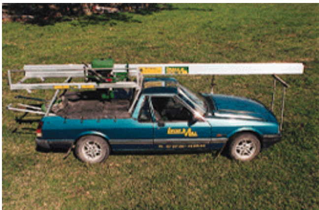
Transportable sur un pick-up