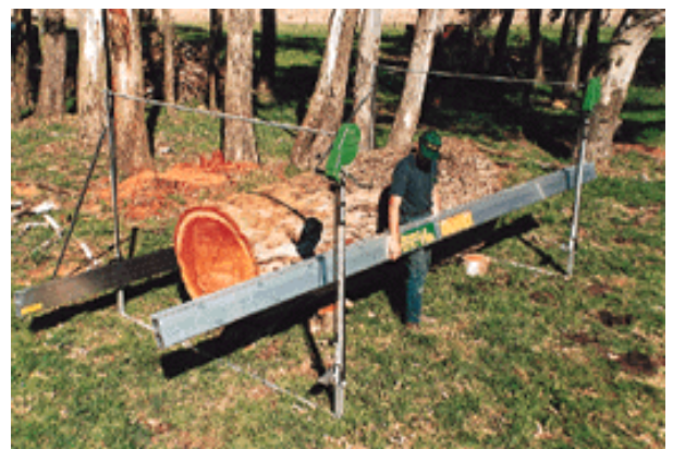
La scie est installée autour de la grume